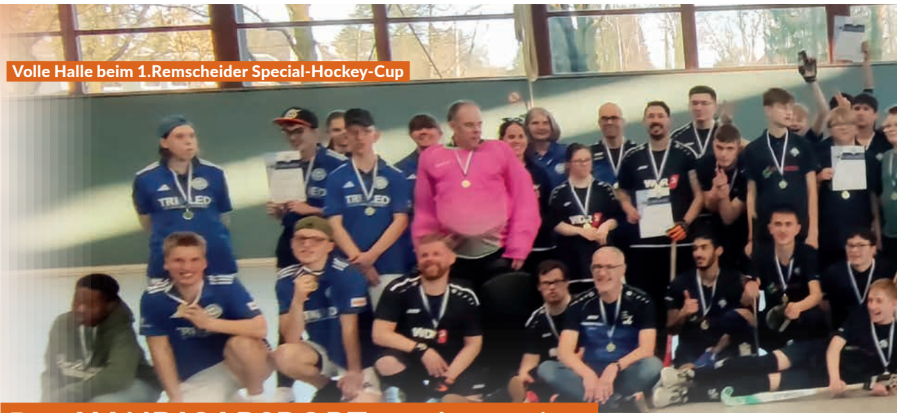
Volle Halle beim 1. Remscheider Special-Hockey-Cup