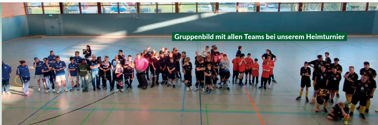
Gruppenbild mit allen Teams bei unserem Heimturnier

DO | 17 Uhr 90 Min | KR FR | 18:30 Uhr 75 Min | KR