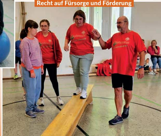
Recht auf Fürsorge und Förderung

Die Behindertensportgruppe, auch Dienstagsgruppe genannt, erfreut sich nach wie vor großer Beliebtheit. Dienstags treiben regelmäßig zwischen 8 und 12 Jugendliche und junge Erwachsene gemeinsam Sport.